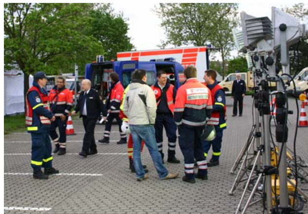
Fachgespräche im rechten Licht

leuchtung unter Beweis. Neben Schmidt-Strahlern und Powermoons wurden auch zwei Lichtmastanhänger mit je 20.000 Watt „Licht“ vorgeführt.