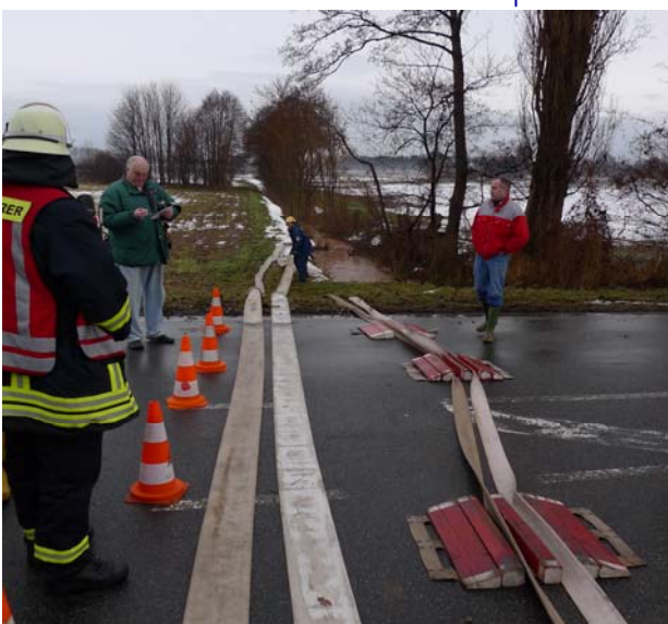
li. F Schläuche, re. Schlauchbrücke