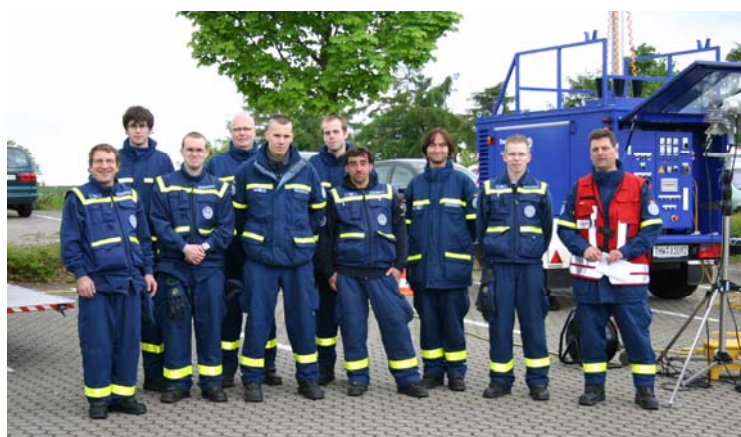
Die „Beleucher“ aus Köln & Euskirchen

Patienten-transport stellte das THW Euskirchen, zusammen mit Kameraden aus Köln, die Fähigkeiten des THW im Bereich der punktuellen und großflächigen Aus-