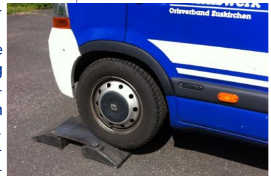
Prototyp 1ter Fahrversuch