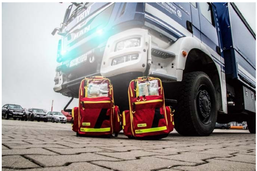
Erweiterte Erste-Hilfe-Ausstattung in Rucksäcken

Darüber hinaus erfolgte die jährliche Kraftfahrerausbildung und Unterweisungsfahrten auf