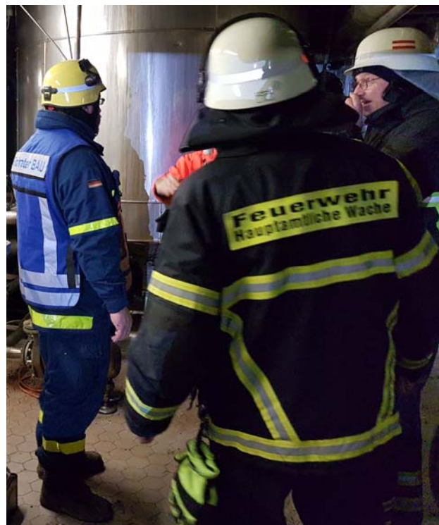
Oben: THW FB BAU und Kräfte der FFW Stadt Euskirchen bei der Erkundung innen,.

MTW TZ, 1/0/1/3, von 07:13 Uhr Alarm bis 09:30 Uhr Wiederherstellung Einsatzbereitschaft.