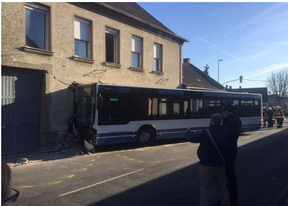
Bus gegen Haus in Bergheim-Eppendorf

Ein neues Fahrzeug - der MLW IV für die FGr WP - hat den Fuhrpark verjüngt, weiteres Stützen ergänzen die Ausstattung für Einsätze z.B. bei Tiefbauunfällen.