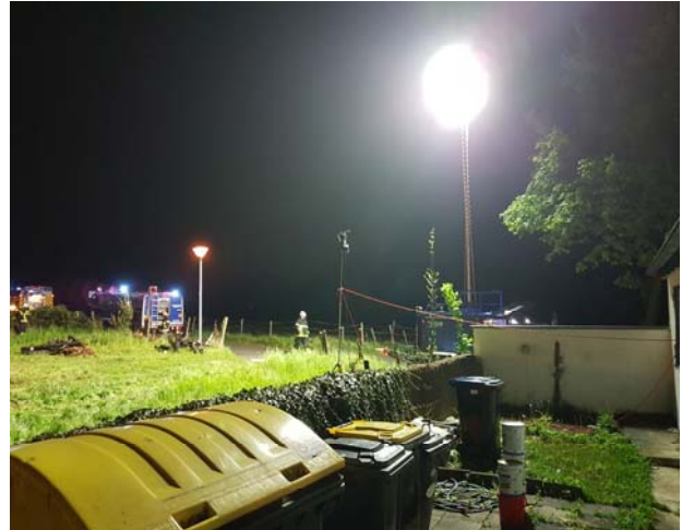
Beleuchtungseinsatz in Wüschheim

Auch 2017 nahmen die Euskirchener THW Kräfte an den beiden Übungen zum Lehrgang "Leitender Notarzt" teil und übernahmen die