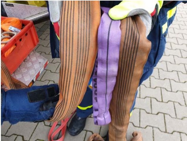
Oben: Kennzeichnung der Anschlagmittel Rundschnur, Ein Strich = 1.000 kg

schäden oder auch die Einträge in den Betriebsstunden- und Fahrtenbücher müssen gekannt werden.