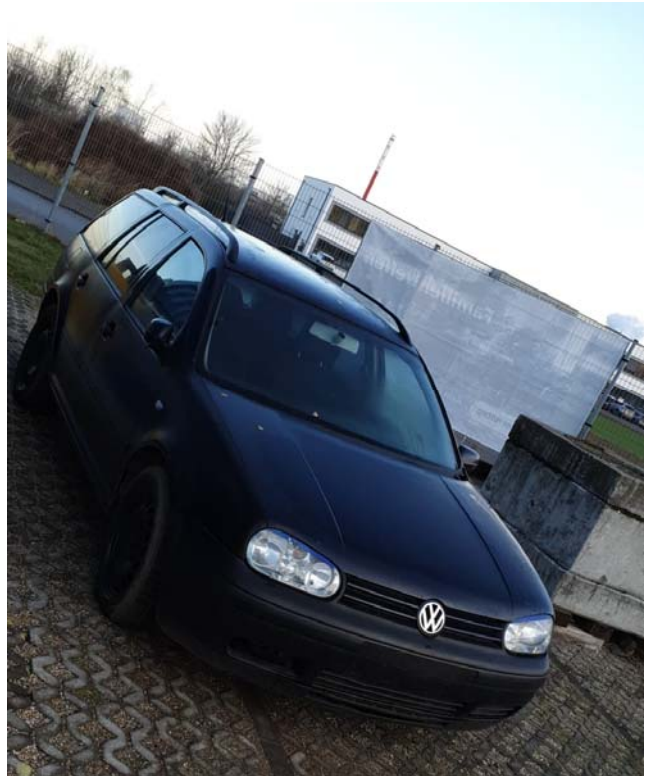
Oben: Das sichere Bewegen von Lasten auf verschiedenen Wegen mit unterschiedlichen Werkzeugen, wird an dem PKW geübt.

Bei allen Aufgaben geht es nicht darum, den PKW zu zerlegen, sondern um das sichere Zusammenspiel von Einsatzkräften, Arbeitstechniken und Werkzeugen. Dabei lernen sich die Feuerwehr'ler und THW'ler besser kennen und Tipps & Tricks werden ausgetauscht.