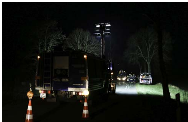
Oben: Licht vom THW bei der Spurenaufnahmen nach einem Verkehrsunfall, Unten: Ausleuchten am Beispiel eines VU

Von der Fähigkeit des THW Euskirchen mit dem Lichtmastanhänger in kurzer Zeit große Flächen auszuleuchten und so für optimale Arbeitsbedingungen für die Verkehrsunfallaufnahme herzustellen, konnten sich die beiden Ersten Polizeihauptkommissare selbst ein Bild machen. Auf dem Gelände des THW in der Otto-Lilienthal-Str wurde ein Unfall mit einem Fahrrad und einem PKW nachgestellt und die Ausleuchtung mittels Lichtmast dargestellt. Außerdem wurde auf der Straße selber eine Kontrollstelle aufgebaut und entsprechend ausgeleuchtet.