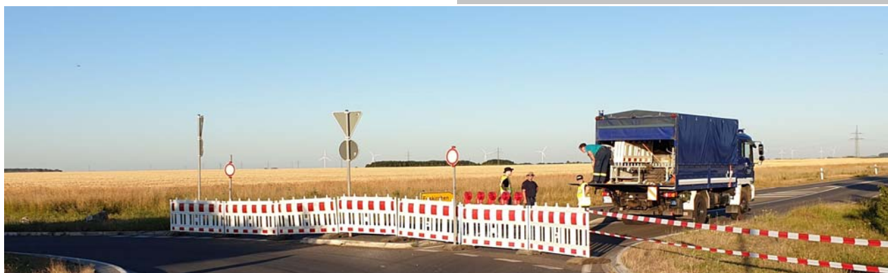
Unten: Sperrung der L264 im Sommer 2019

Darüber hinaus wurden weitere Unterstützungsmöglichkeiten durch die beiden THW Ortsverbände im Kreis Euskirchen vorgestellt. Weitere Treffen zur Intensivierung der Zusammenarbeit wurden vereinbart.